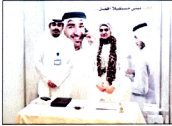
جناح الشركة في المعرض

وكالات بيع السيارات العالمية والمركبات التجارية وصيانتها وبيع قطع غيارها، وإطارات السيارات، والساعات السويسرية المشهورة، ومعدات الطباعة، وتصنيع وتعبئة المرطبات، والشحن والتغليف، ووكالات السفر.