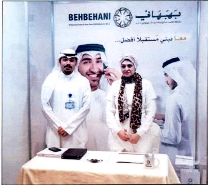
جناح الشركة في معرض الفرص الوظيفية